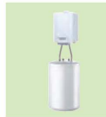
EMC-M / BS 80

Υ 55.4 cm Π 36.8 cm Β 36.4 cm 81 kg Δοχείο: Υ 91.2 cm • Ø 57 cm